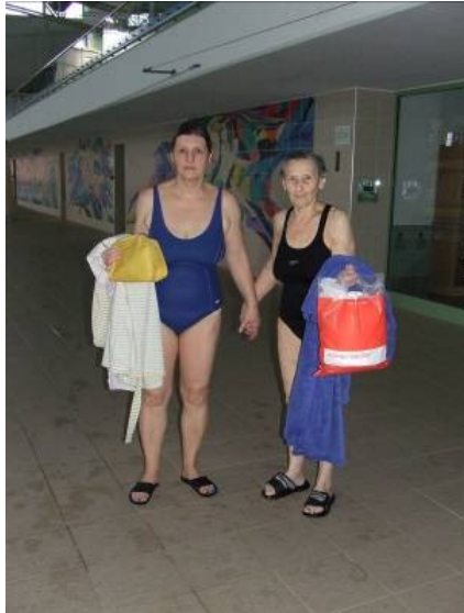
Húgom és Édesanyám érkeznek