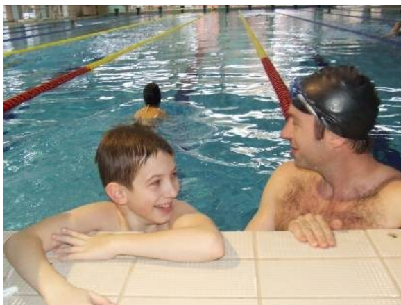
Zalán még úszik!