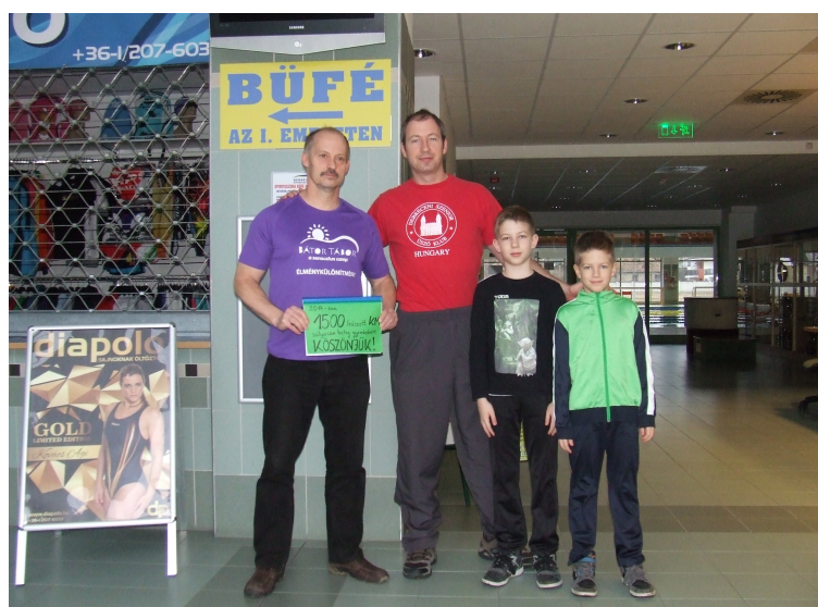
A Pázmányi fiúkkal