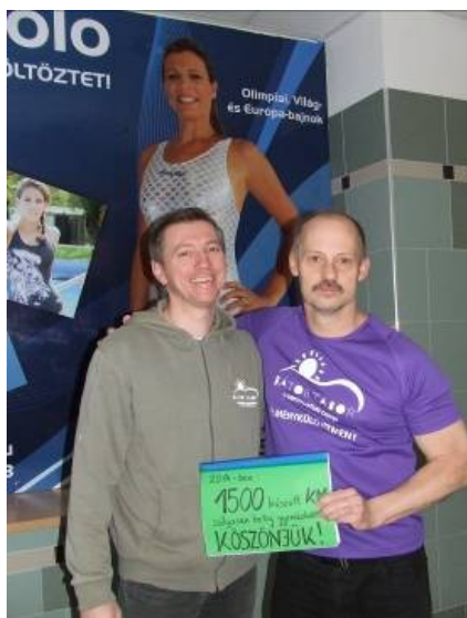
Kiss Ambrussal a Bátor Táboról

Képek szerkesztése 2015. december 2-én 0:08 percig: