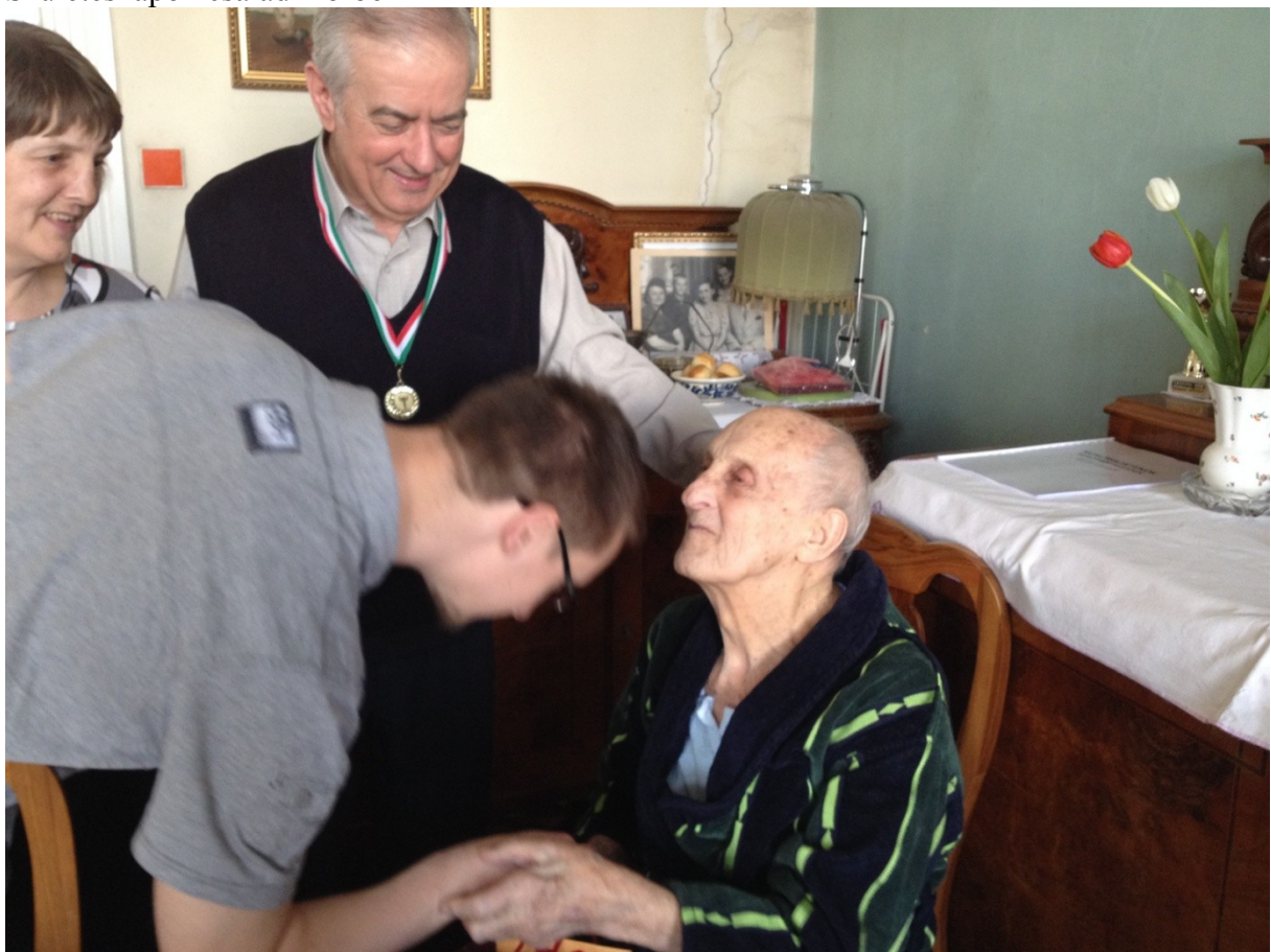
Sok szeretetet kaptunk tőle