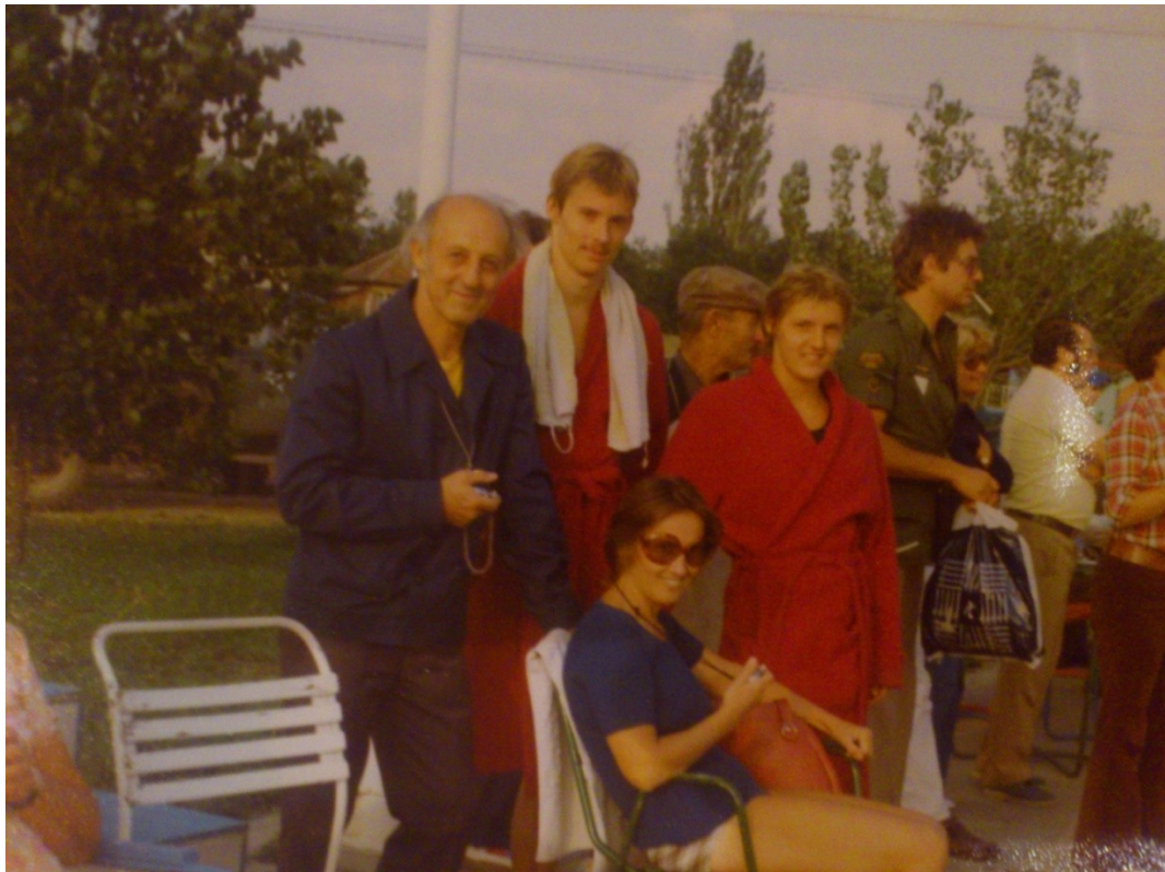
Egy derűs mosoly verseny után