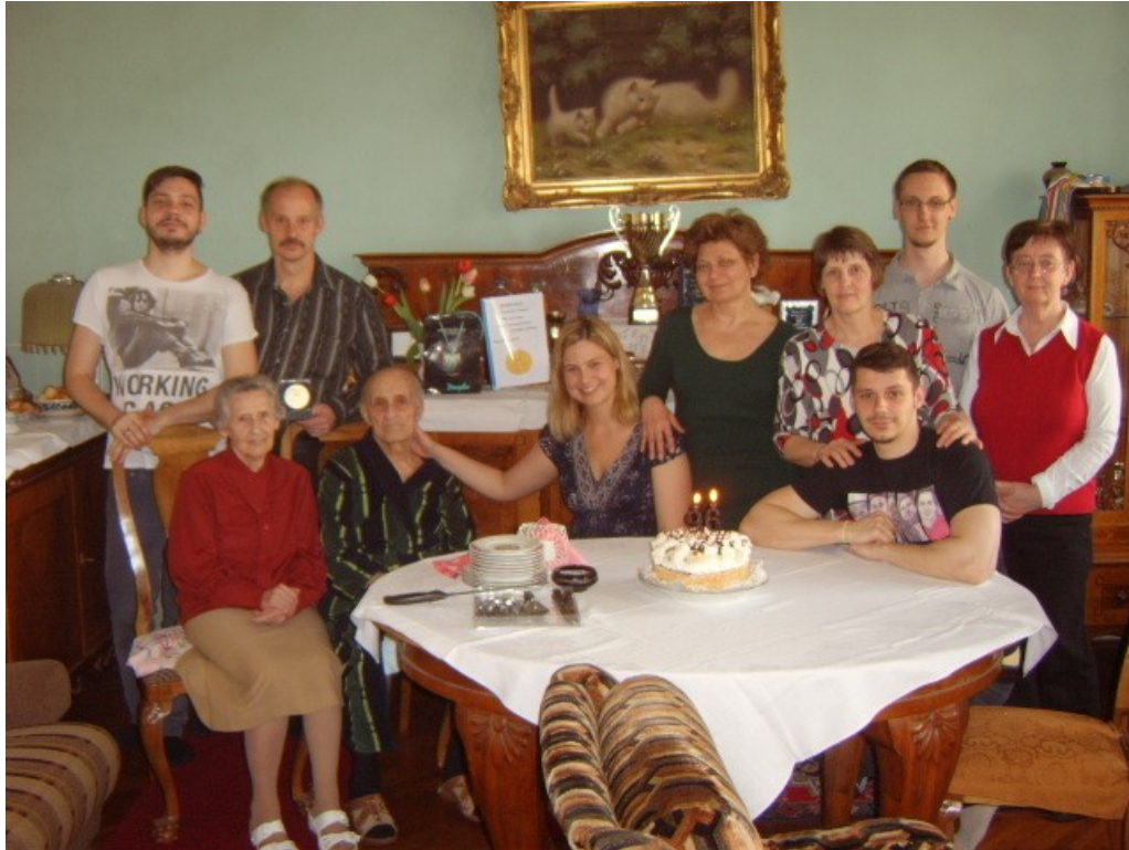
Születésnapok családi körben