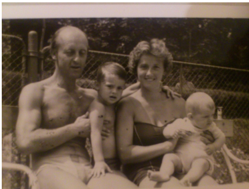
A strandon 1960-ban

Idén, április 18-án nem ülünk körül a nagy ebédlőasztalt. De betöltjük az uszodát hangos, gyermeki jókedvvel. És fotó is készül majd. Sokan leszünk rajta, kicsik és nagyok, fiatalok és örökifjak, gyermekek és unokák. Örülünk egymásnak, a közös mozgás örömeinek, az életnek. Mindenki tudja, kit ünnepelelünk. Olyan, mintha ő is köztünk lenne. Nyakában ott az elmaradhatatlan síp, kezében a stopper. Nincs lazsálás, kezdődik az edzés. A végén váltózunk egy jót. És köszönetet mondunk mindenért.