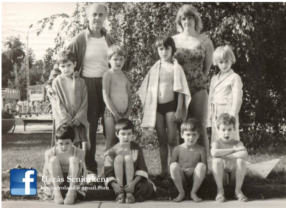
Néhány apró tanítványával, háttérben a négyméteres